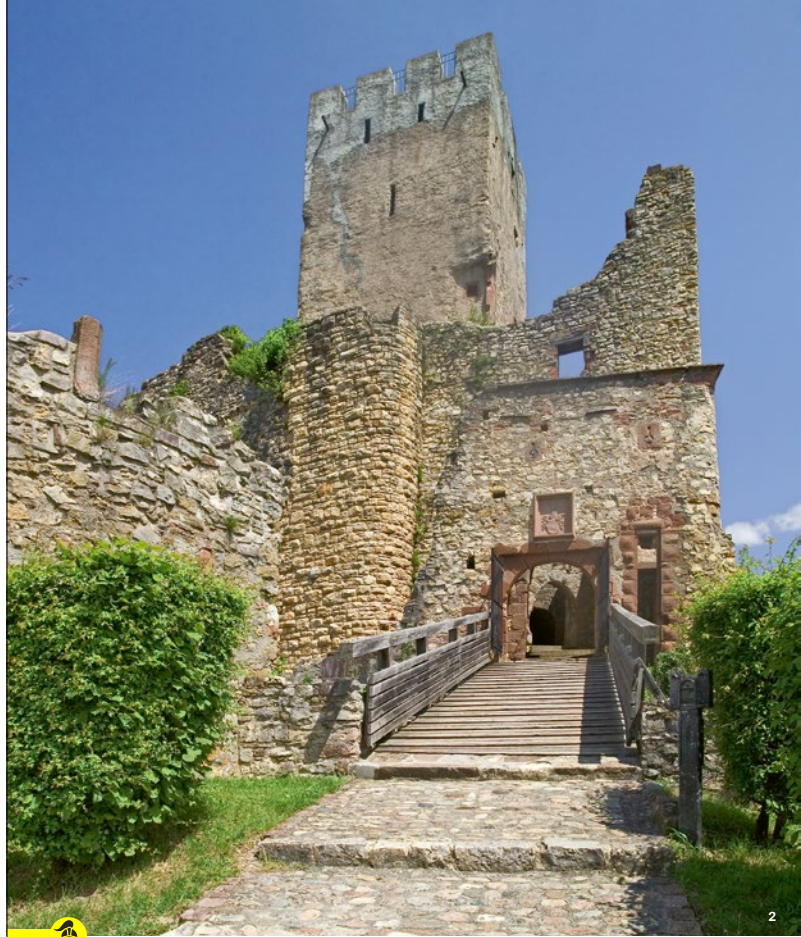
Steil führt der Weg zum Burgtor hinauf

durch Erbfall in den Besitz der Herren von Hachberg-Sausenberg, einer Nebenlinie des Hauses Baden. Nun erlebte die Burg ihre größte Blüte: Weit gestreuter Besitz vom Hochrhein bis nach Südfrankreich sowie weit gespannte Beziehungen machten sie zu einem kleinen Zentrum des Kulturaustauschs zwischen dem Gebiet des heutigen Südwestdeutschlands und den französisch geprägten Gebieten.